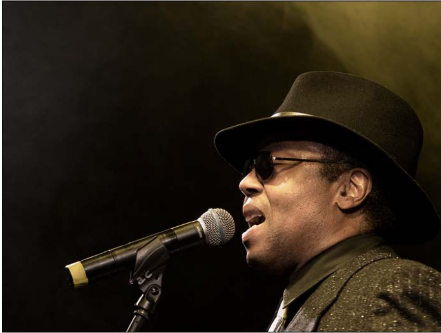
Mountain Dew – american music

Mountain Dew nennen die amerikanischen Hillbillies ihren schwarzgebrannten Schnaps. Kein Name könnte die Musik dieser sympathischen Band besser beschreiben, denn was es hier zu hören gibt ist hochprozentig, pur und handgemacht. Mountain Dew greift nach den Wurzeln amerikanischer Musik – straight und ohne Schnörkel. Country-Klassiker, Western Swing, Rockabilly und Rock 'n Roll bilden das Fundament eines abwechslungsreichen Programms das, mit eigenen Stücken garniert, bis zu New Country reicht – that's american music!