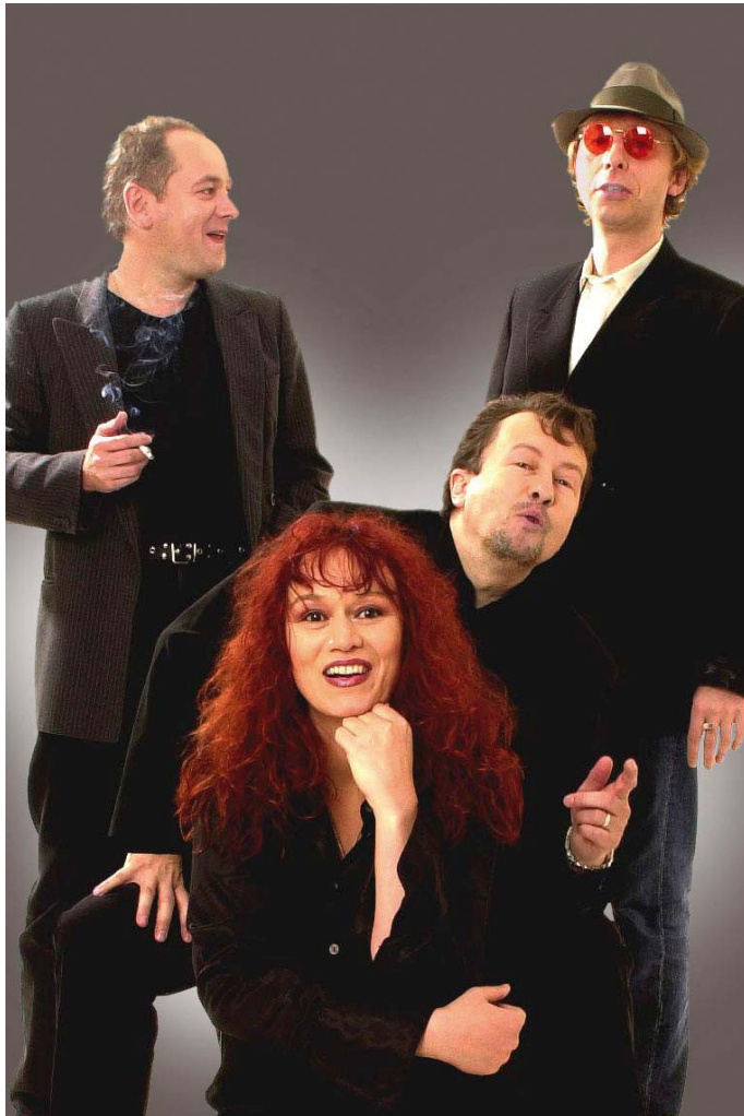
The Lucky Ones